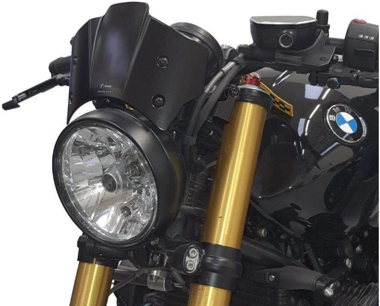
Windschild, Typ ZBW102